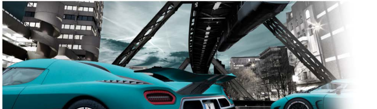
Bilder 2 bis 5: