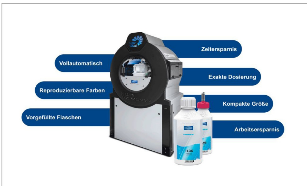
Bildunterschrift: Standox weist den Weg in die Zukunft der Farbtonmischung mit Daisy Wheel 3.0

André Koch AG Presseinformation, 06. Juli 2021 Standox setzt auf die Zukunft des Farbmischens: Daisy Wheel 3.0